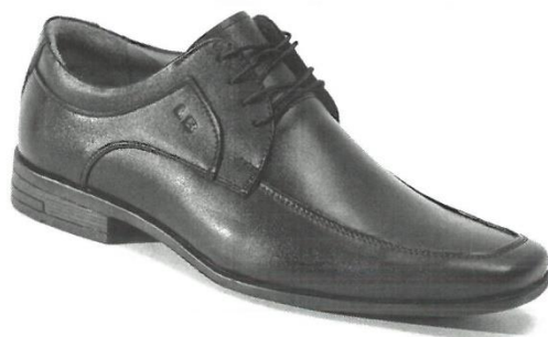
CALZADO PARA VARÓN