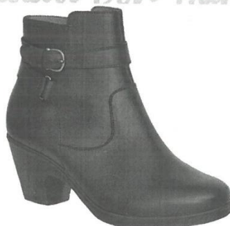
CALZADO PARA DAMA