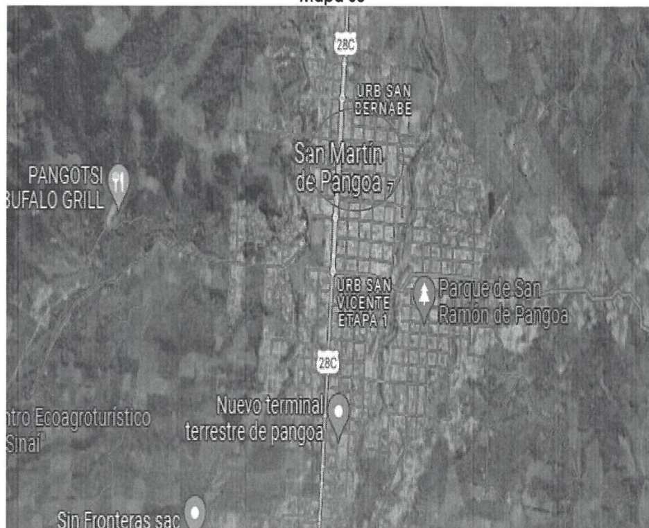
LOCALIZACION DEL PROYECTO