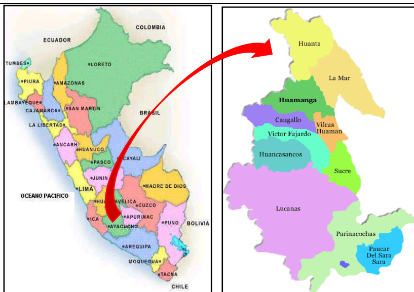
PROVINCIA DE HUANTA.