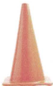
CONO DE SEGURIDAD