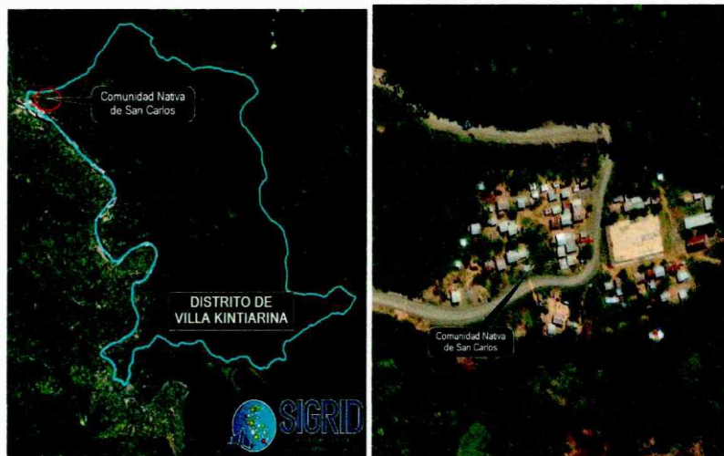
Fig.03: Planteamiento identificado San Carlos

Servicio de agua potable proyectado (el proyectista puede mejorar el planteamiento preliminar, según los estudios básicos elaborados)