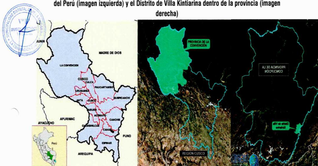
Fig. 01: Ubicación de la Provincia de La Convención, dentro de la región de Cusco- departamento del Perú (imagen izquierda) y el Distrito de Villa Kintiarina dentro de la provincia (imagen derecha)