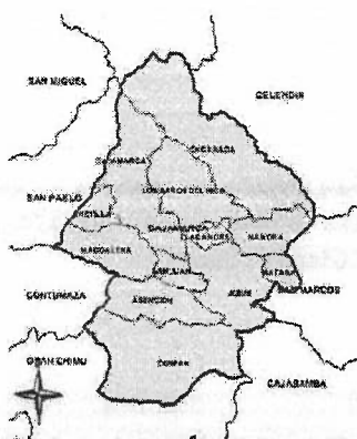
Figura 2 Ubicación de la Institución educativa