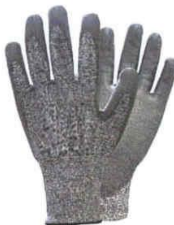
GUANTES DE TRABAJO