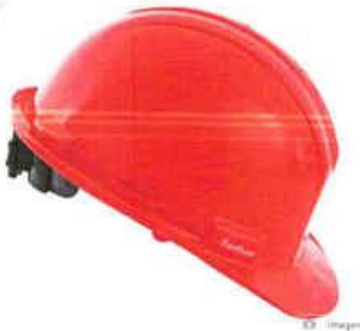
CASO DE SEGURIDAD