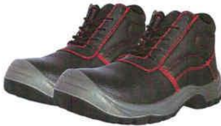
ZAPATOS DE SEGURIDAD TRABAJO – SEGURIDAD