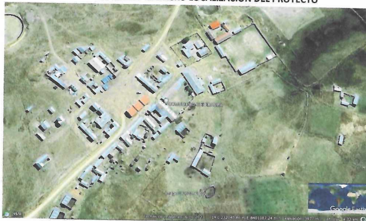
IMAGEN N° 1: MICRO LOCALIZACIÓN DEL PROYECTO