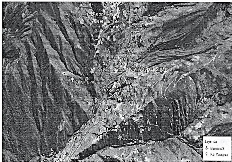
Imagen 1 Localización del sector a intervenir

Departamento : Huánuco Provincia : Ambo Distrito : Ambo Lugar : Maraypata.