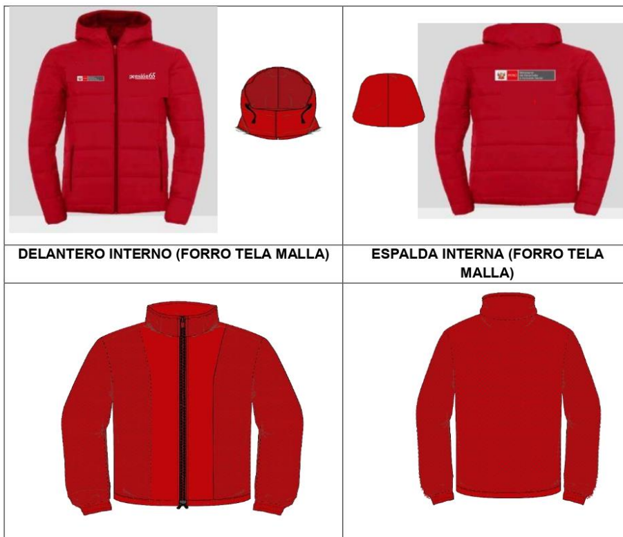
DELANTERO INTERNO (FORRO TELA MALLA)

"Año del bicentenario, de la consolidación de nuestra independencia y de la conmemoración de las heroicas batallas de Junín y Ayacucho"