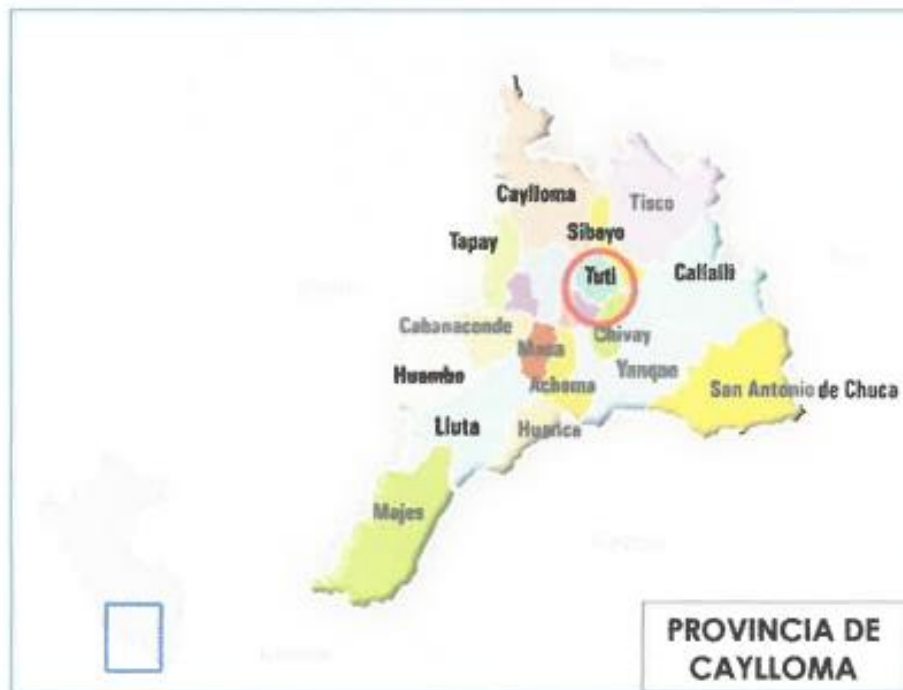
• Figura 1: Ubicación Del Distrito De Tuti

"Año del Bicentenario, de la consolidación de nuestra Independencia, y de la conmemoración de las heroicas batallas de Junín y Ayacucho"