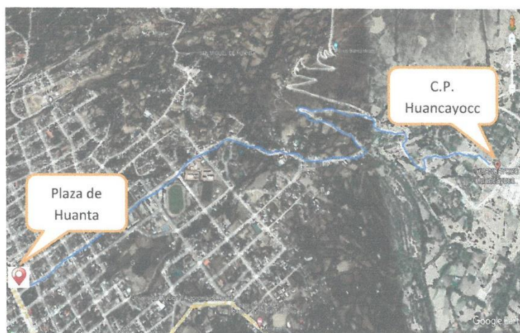
Ruta de la plaza de Armas de Huanta al C.P. Huancayocc de 6 Km de distancia

CROQUIS DE LA UBICACIÓN DEL ALMACEN DE LA OBRA: "CREACION DE CAMINO VECINAL DE LOS SECTORES DE CALVARIO PAMPA A TANTARNIYOCC HUAYCCO DEL CENTRO POBLADO DE HUANCAYOCC, DISTRITO DE HUANTA, PROVINCIA DE HUANTA, DEPARTAMENTO DE AYACUCHO".