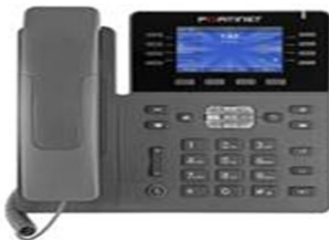
DataSheet de teléfonos FortiNet

FON-380B The FON-380B is designed for collaborative workplaces, regardless of your business size. Its crystal clear audio and ease of use with the FortiVoice make this a fantastic phone while working from home or in the office. • 10 dedicated feature keys • 28 programmable appearance keys • 3.5 inch color display screen • Supports both on-premises or cloud solutions • Configuration is simple and intuitive