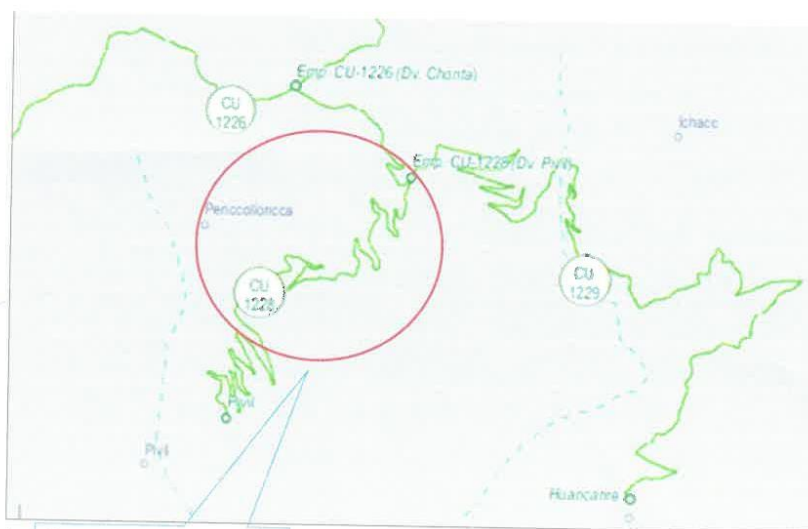
Camino Vecinal: Pampahuaylla-Chonta-Pivil

El contratista debe cumplir los siguientes requisitos: