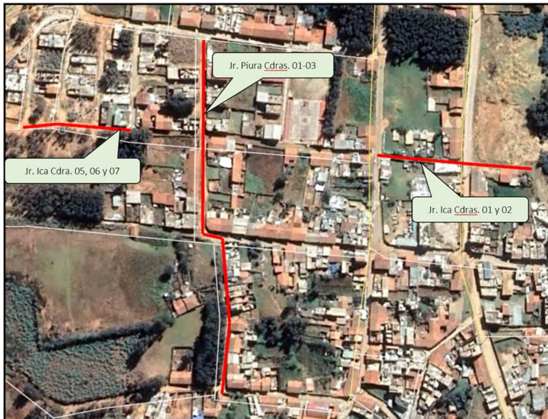
IMAGEN 04. UBICACIÓN GEOGRÁFICA DEL LUGAR DE LA INVERSIÓN