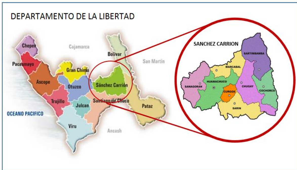
IMAGEN 02. UBICACIÓN GEOGRÁFICA DE LA PROVINCIA DE SÁNCHEZ CARRIÓN