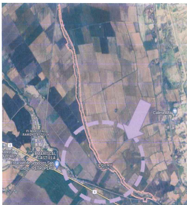
Figura 3 Ubicación del ámbito del proyecto, Centro Poblado Puente Mayta.