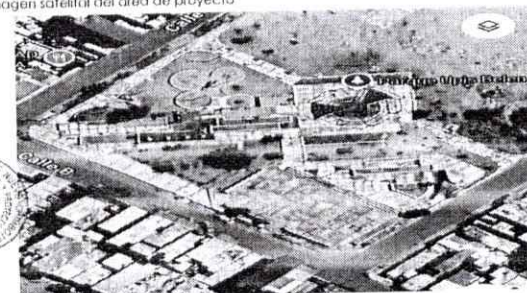
Imagen satelital del área de proyecto

De acuerdo a la Alternativa seleccionada de la Ficha Técnica Simplificada viable según código único de inversión de proyecto N° 2659155, se tienen las siguientes metas: