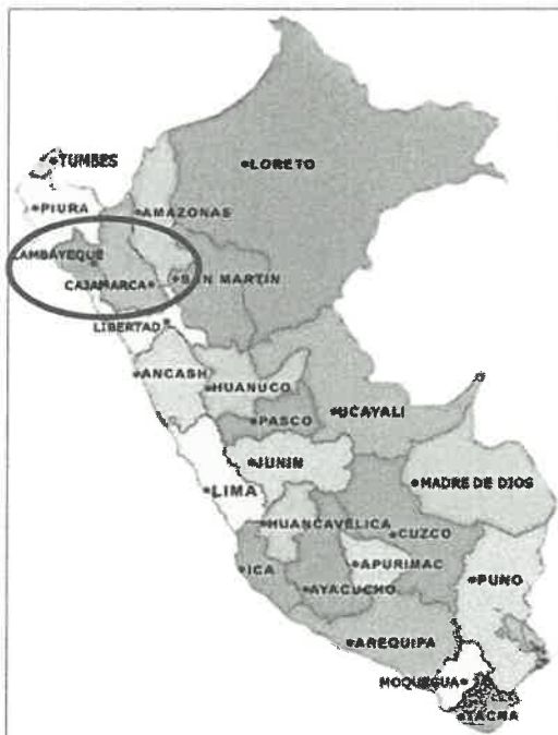
IMAGEN N° 01: UBICACIÓN DEL DEPARTAMENTO DE LA LIBERTAD