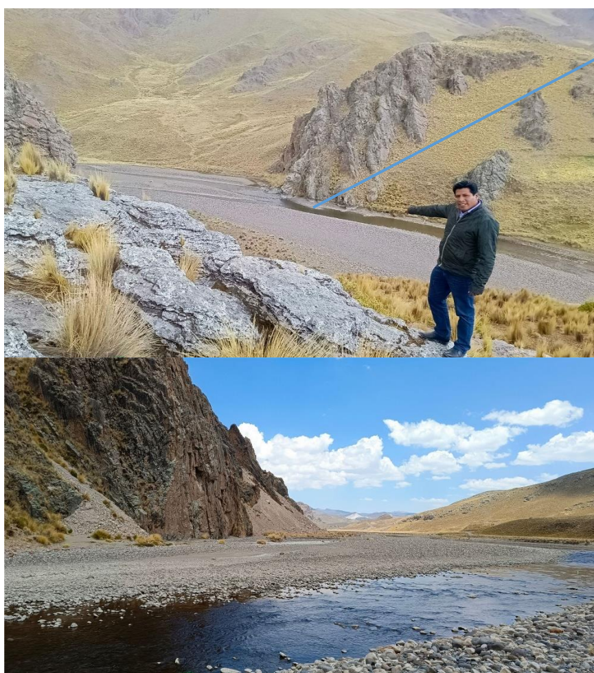
FUENTE DE AGUA

El punto de captación de la fuente de agua es la cuenca y sub cuencas del rio llave, a partir de ahí se deriva sus aguas a través de la infraestructura de conducción precaria.