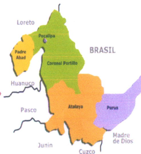
Mapa macro localización del departamento de Ucayali