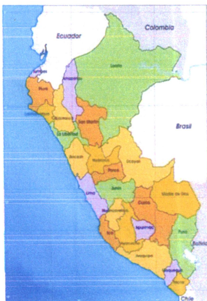
Mapa de macro localización del Perú

La zona a intervenir, está ubicada en la parte sur este de la ciudad de Pucallpa, perteneciendo a la zona urbana periférica de la ciudad.