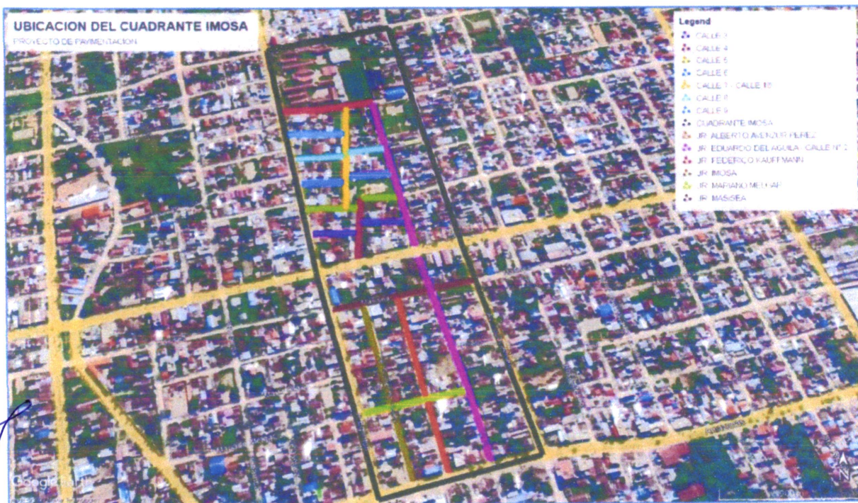
FIG. N°01 UBICACIÓN – A.H. TUPAC AMARU, A.H. EDUARDO DEL ÁGUILA, HU. LOS FRUTALES Y H.U IMOSA