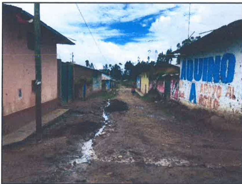
FOTOGRAFIA 9: Conexión Domiciliaria en el Distrito de San Pedro de Chaulán.

"Año de la unidad, la paz y el desarrollo"