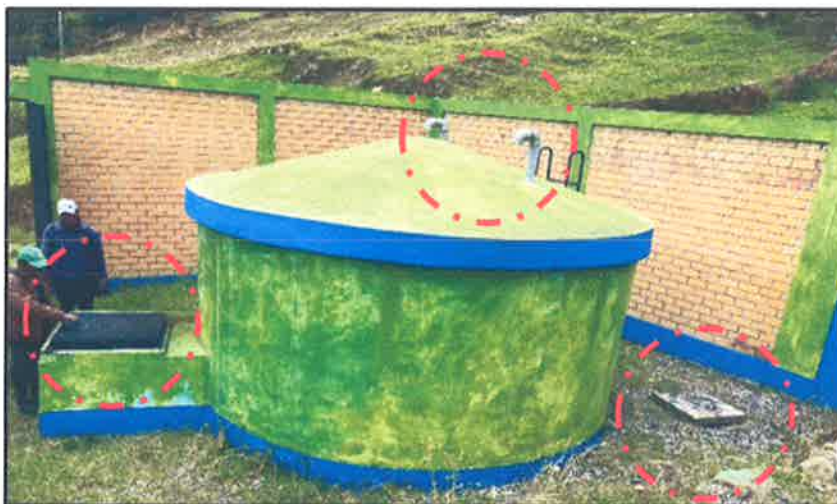
FOTOGRAFIA 3: Reservorio Existente Apoyado (RE-01)

"Año de la unidad, la paz y el desarrollo"