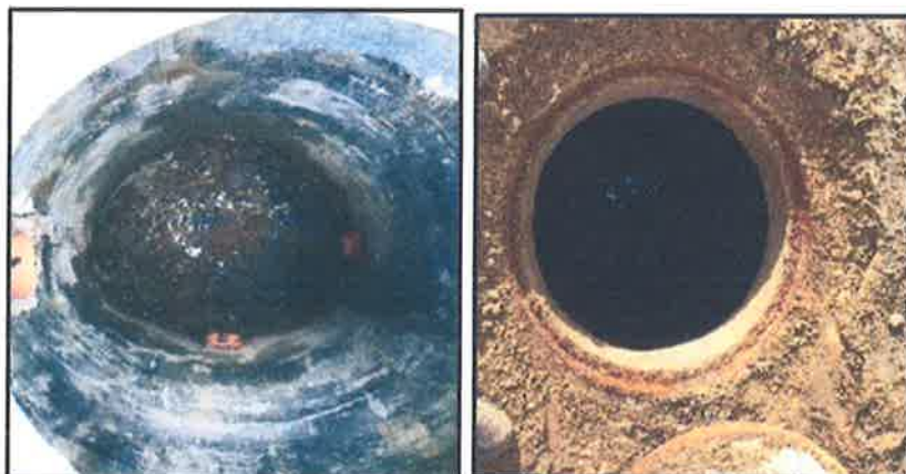
FOTOGRAFIA 10 - 11: Buzones en mal estado.

El sistema de recolección y disposición de aguas servidas se efectúa por gravedad, y a través de tuberías de servicio de PVC diámetro de 200 mm, buzones de 1.20 m.