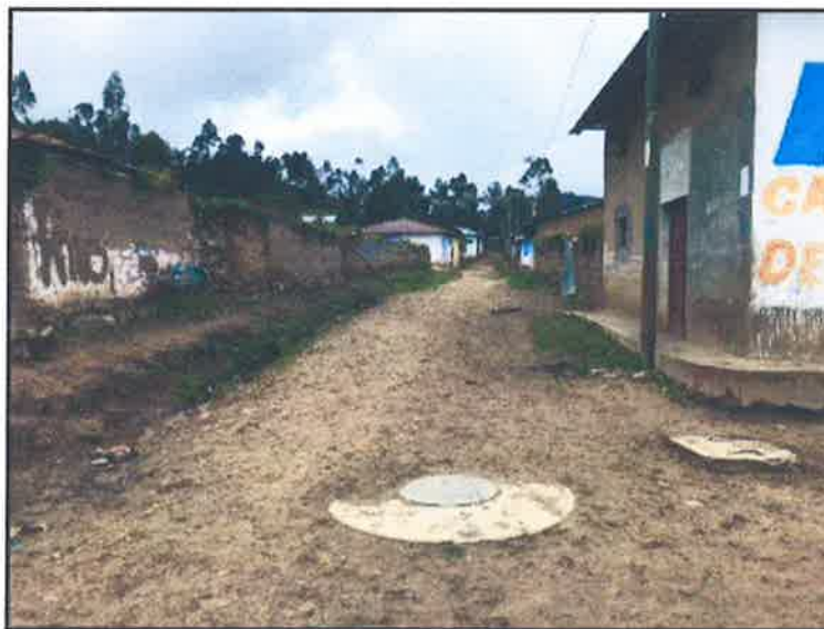
FOTOGRAFIA 14: Sistema de Alcantarillado de la Zona.