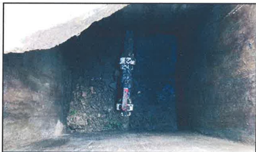
FOTOGRAFIA 8: Caja de Válvula de Control.

El distrito de San Pedro de Chaulán cuenta con 264 conexiones en los que no figuran los usuarios de tipo comercial e industrial.