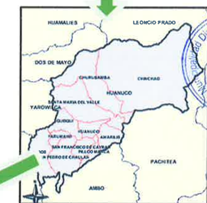
Mapa de la Provincia de Huánuco