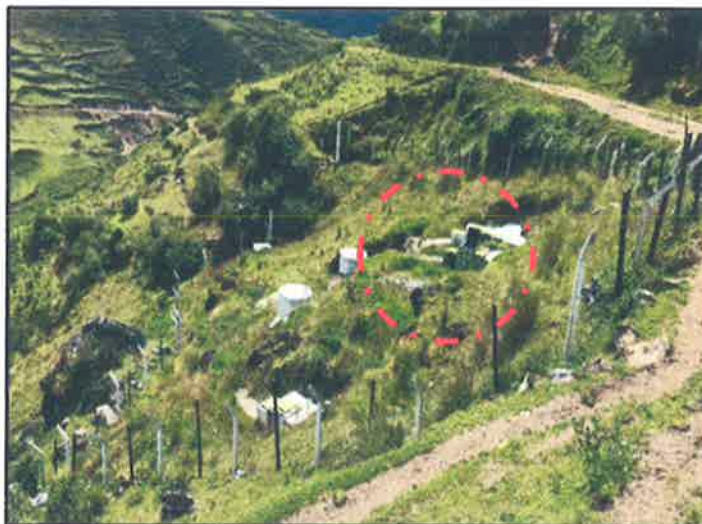
FOTOGRAFIA 2: Captación proyectada cercana a captaciones existentes que no funcionan.

“Año de la unidad, la paz y el desarrollo”