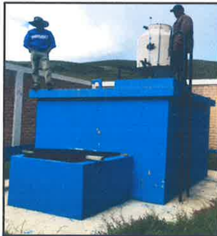
FOTOGRAFIA 6: Reservorio Existente Apoyado RE-02.

Estructura de concreto armado del tipo apoyado, ubicada en la cota 3685 msnm, cuyo volumen es de 10 m 3 , cuenta con caseta de válvulas, tuberías de ventilación, escalera y tapas metálicas pintadas. El sistema cuenta con cerco perimétrico de material noble. Se observa sistema de cloración en sus accesorios completos sin sistema de protección de rayos UV.