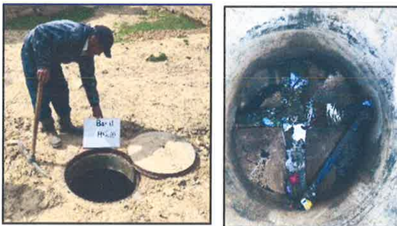
FOTOGRAFIA 12 - 13: Buzones en mal estado.

“Año de la unidad, la paz y el desarrollo”