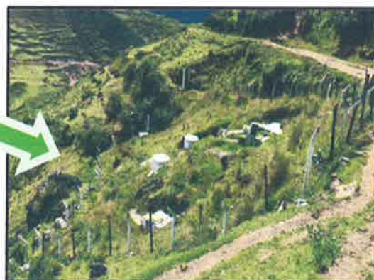
Fotografía de la Captación