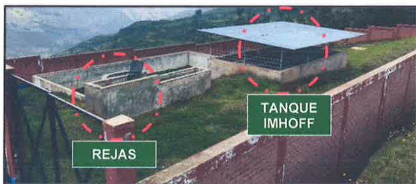
FOTOGRAFIA 15: Tanque IMHOFF (Tratamiento de Aguas Residuales)

Este sistema de Tratamiento Primario se encuentra apartado de la población entre cotas de 3510 - 3512 msnm.