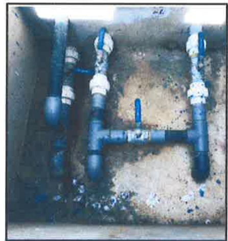
FOTOGRAFIA 7: La caja de válvulas.

La válvula de control de sectorización de las redes de distribución de agua dentro de la caja que la contiene hay presencia de arena y rocas. La tapa de la caja de válvula se encuentra deteriorada.