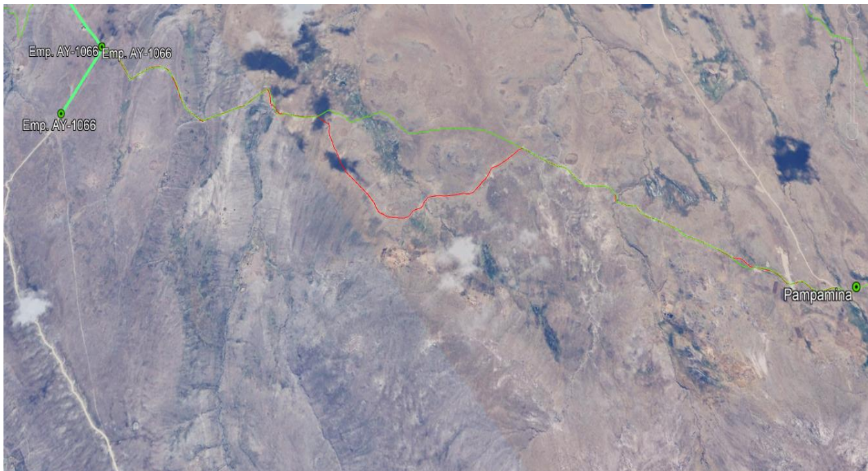
Imagen satelital google heart, de la ubicacion del tramo

El acceso al tramo es por la carretera Ayacucho – Huancapi – Sucre