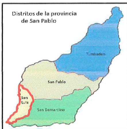
Ilustración 3: Mapa de Localización del Proyecto.