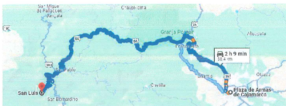
Cuadro N° 1: Cuadro de Acceso hasta el Distrito de San Luis