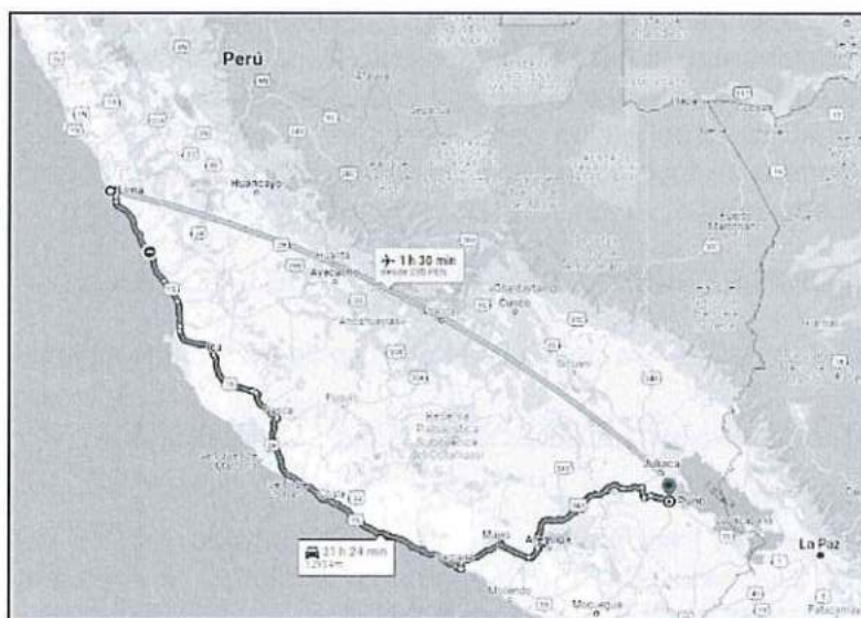
Imagen 3 Mapa de acceso desde Lima hasta la Plaza Central de Puno

Es accesible desde el centro del distrito de Puno a través de la carretera Puno Juliaca, por un desvío de acceso en su mayoría trocha carrozable de la zona denominada Alto Puno, dicha vía comunica Puno con la localidad de Ticquillaca.