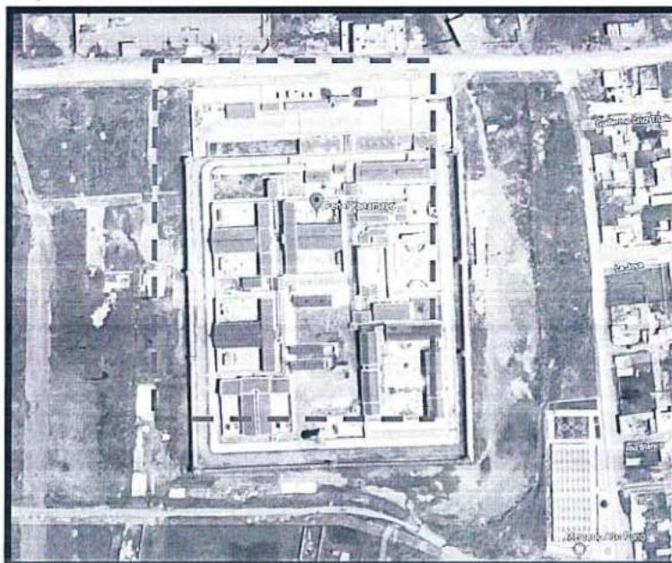
Imagen 1: MAPA DE LOCALIZACIÓN DEL ESTABLECIMIENTO PENITENCIARIO DE PUNO