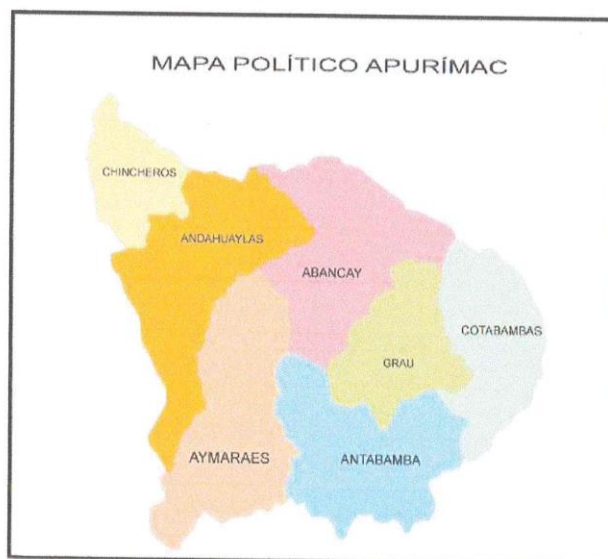
Imagen N°1. Mapa político Provincias de Apurímac.