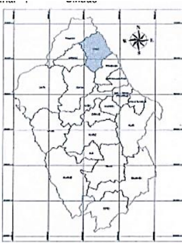
UBICACIÓN GEOGRÁFICA DE LA PROVINCIA DE SIHUAS ESCALA 1:1,000,000