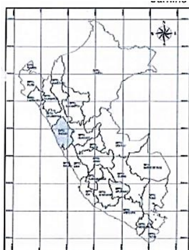
UBICACIÓN GEOGRÁFICA DEL DEPARTAMENTO DE ANCASH ESCALA 1:30,000,000