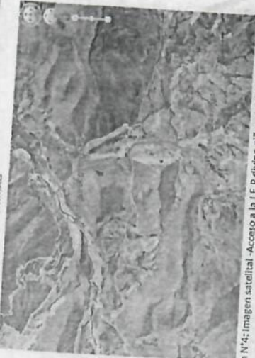
Imagen N°4: Imagen satelital - Acceso a la I.E.P divino niño e Jesús.