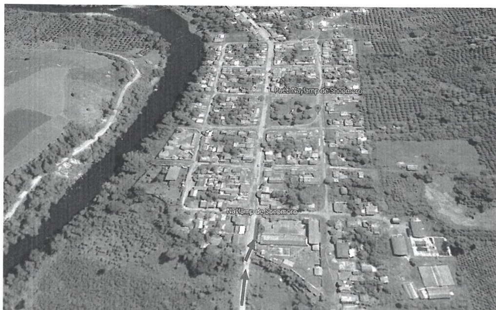
Mapa 1. MACRO LOCALIZACIÓN