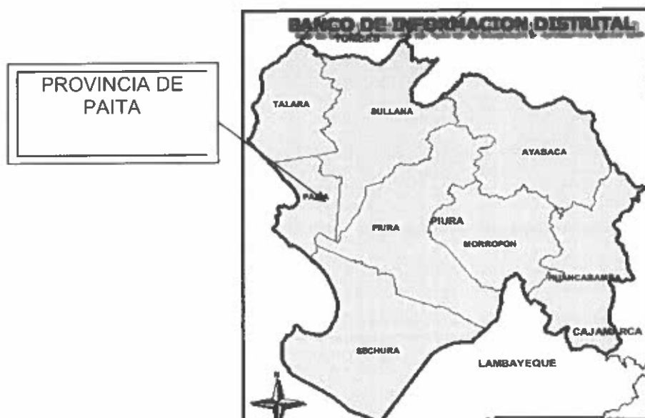
Esquema de Ubicación Geográfica en el Mapa de la Provincia de Paita.