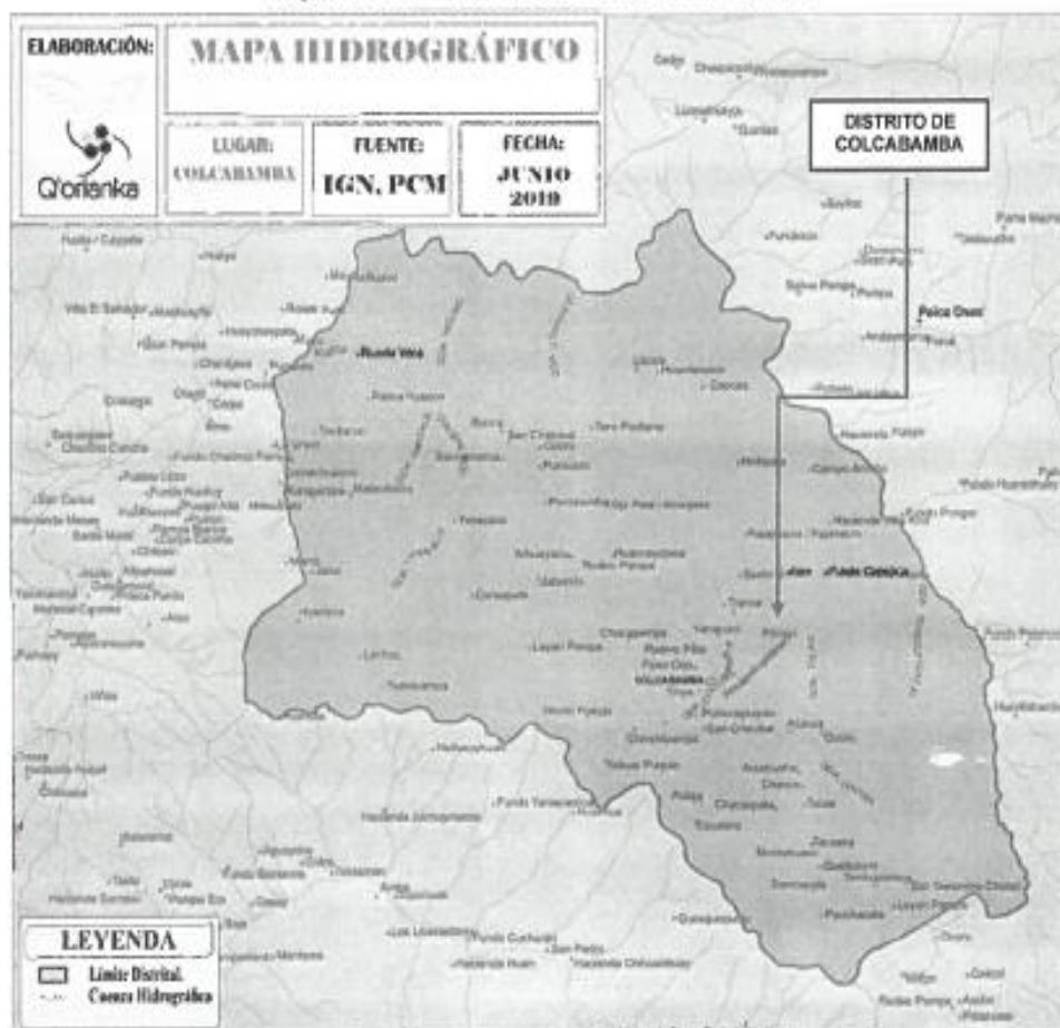
Figura N° 03 - Ubicación Distrital del Proyecto

Proyecto Especial de Desarrollo del Valle de los Ríos Apurímac, Ene y Mantaro PROVRAEM