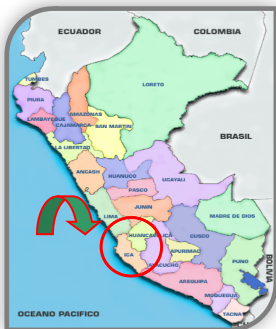
GRAFICO: 2.1.01