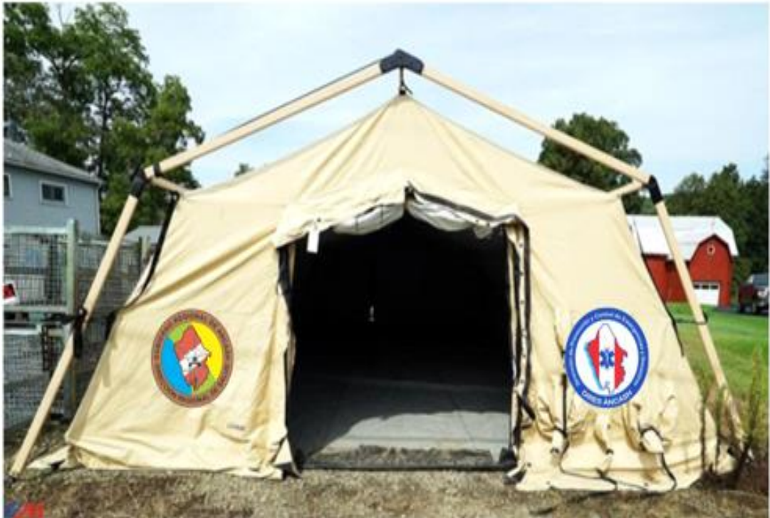
ANEXO N° 02