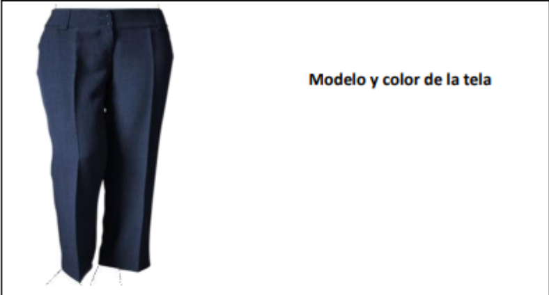
Modelo y color de la tela