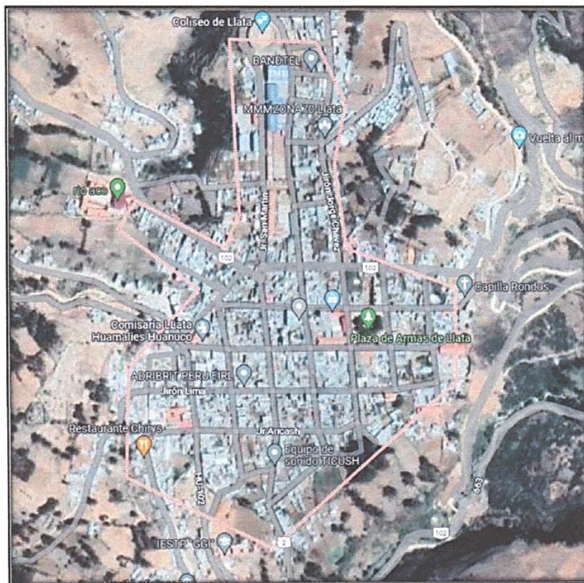
LUGARES A INTERVENIR

Jr. San Martín Cuadras 1, 2, 3, 4 y Pasaje Los Olivos cuadra 1