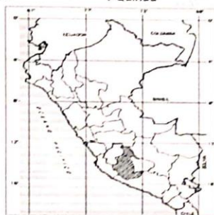
MAPA DEL PERU