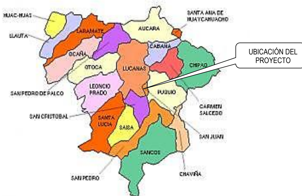
Mapa N° 04.- Zona del proyecto