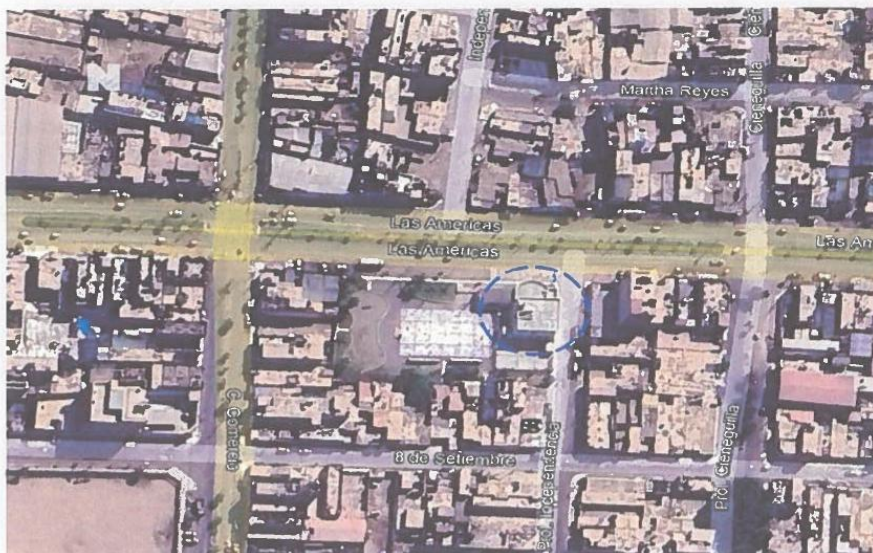
IMAGEN 1 Ubicación de la Central de Monitoreo y Vigilancia