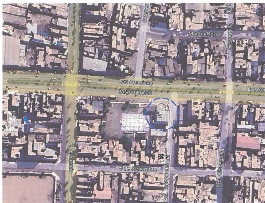
IMAGEN 2 Ubicación actual de la Centro de Monitoreo

El plazo total necesario para la elaboración del Proyecto de Inversión Pública y Entrega de este es de noventa (90) días calendarios computables a partir del día siguiente de la firma del Contrato.