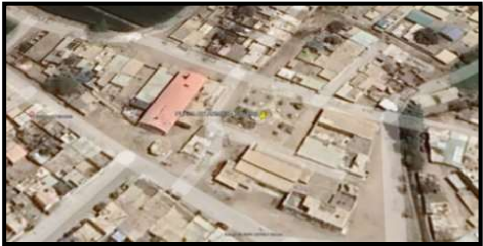
IMAGEN N°2: Vista satelital de la localización del proyecto, en la imagen se muestra la PLAZA DE ARMAS DEL CENTRO POBLADO VINZOS, la cual tiene las coordenadas UTM mencionadas en el cuadro superior

El acceso principal al área del proyecto es por vía terrestre, tomando la Carretera de Penetración al cañón del pato (Huallanca). Desde la plaza de armas hasta el C.P. VINZOS, a continuación, se indica la distancia y el tiempo de desplazamiento desde el principal centro urbano a la zona donde se plantea el proyecto. La obra se encuentra ubicada a unos 25 minutos del centro del distrito de Santa Casco Urbano.