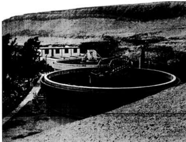
Planta de tratamiento de agua potable Cata Cata, capacidad instalada de 500 l/s, tecnología patentada Degremont.