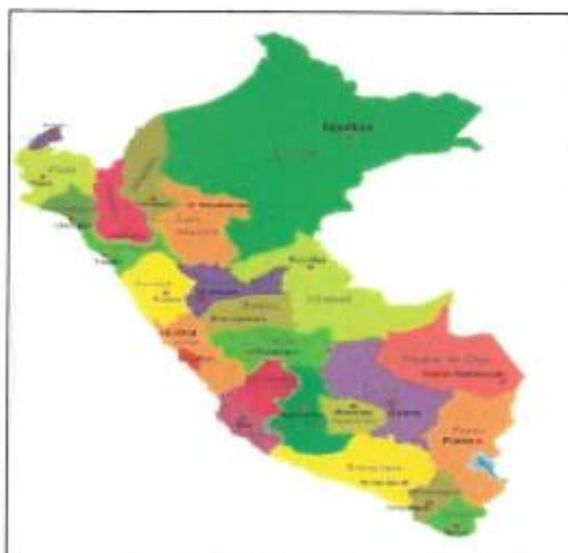
Mapa Político del Perú.

Coordenadas: Este : 825195.00 Norte : 9163649.00 Altitud : 3068 m.s.n.m. Zona : 17S