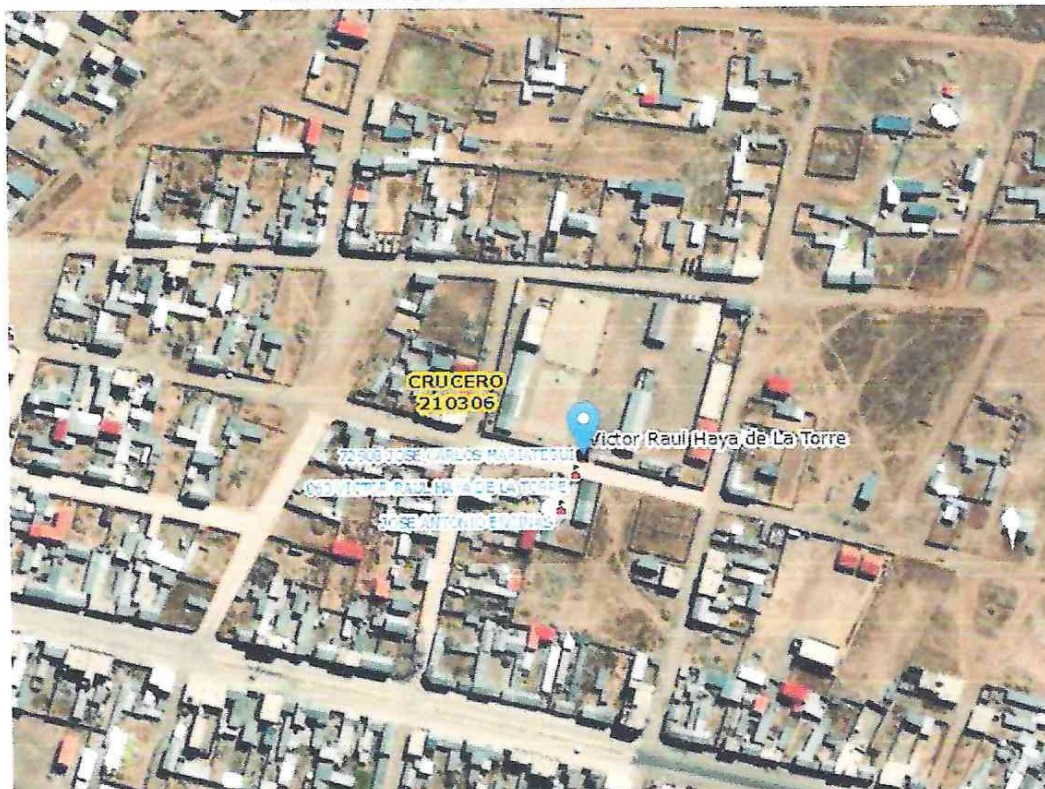
ILUSTRACIÓN UBICACIÓN DE LA INSTITUCIÓN EDUCATIVA

Zona : 19 L Latitud : -14.362575 Longitud : -70.01556