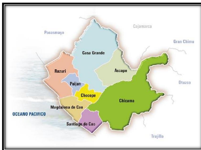
PROVINCIA DE ASCOPE