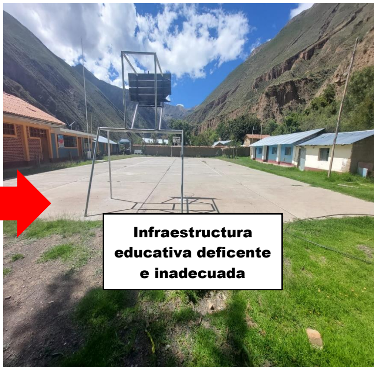
Infraestructura educativa deficiente e inadecuada

Educación Básica Regular Nivel Primaria en la I.E N°38985 de característica POLIDOCENTE MULTIGRADO , ubicado en el Centro Poblado de SAN ANTONIO CCECHAHUA, Distrito de Sarhua, Provincia de Víctor Fajardo, Departamento de Ayacucho.