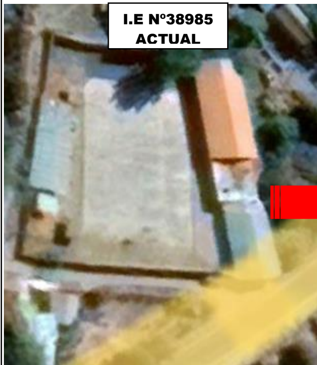
I.E N°38985 ACTUAL