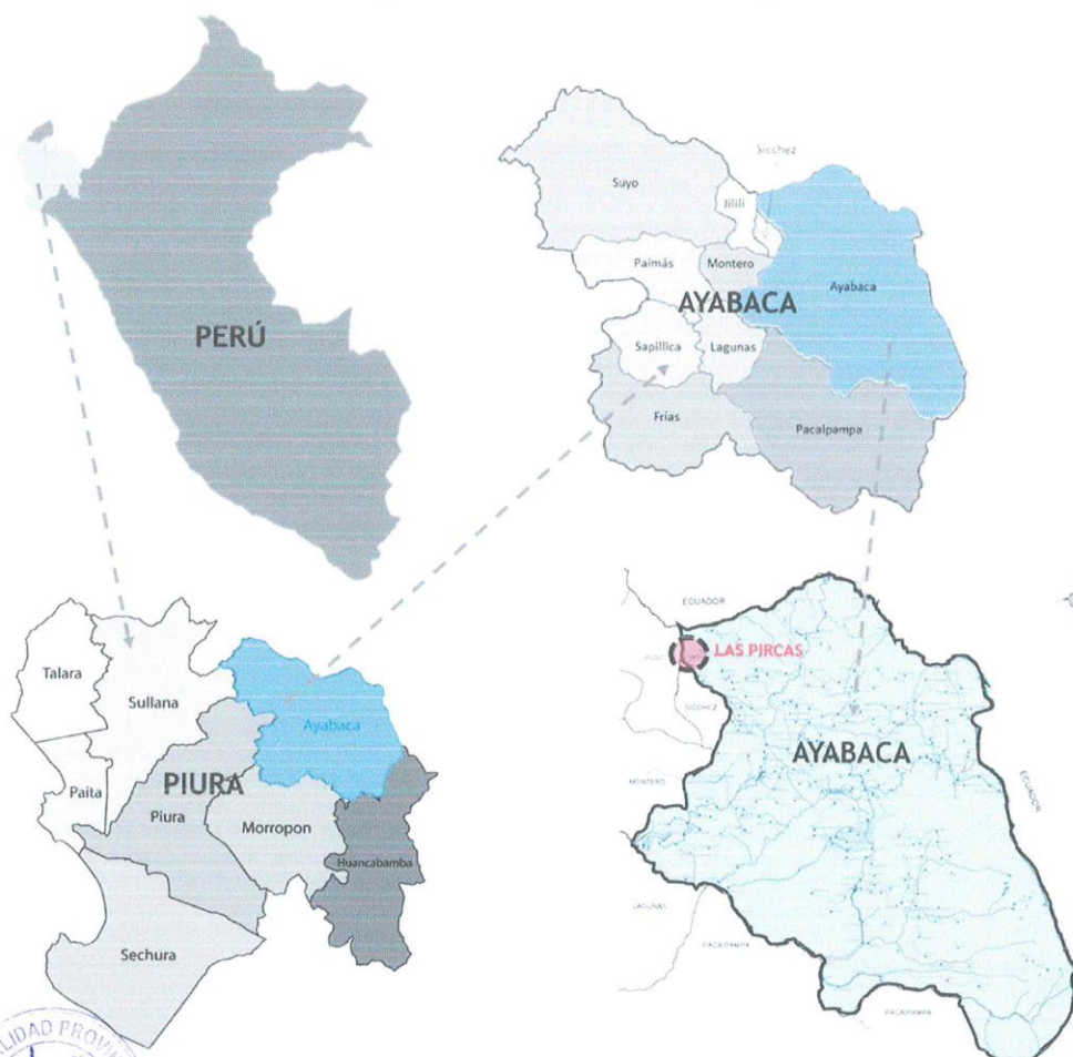
Figura N° 1. Macro - localización

SERVICIO DE EJECUCION DE LA FICHA DE INTERVENCION POR EMERGENCIA DENOMINADA: "LIMPIEZA Y DESCOLMATACIÓN DE LA QUEBRADA LAS PIRCAS Y CONFORMACIÓN DE DIQUES CON MATERIAL PROPIO Y ENROCADO AL VOLTEO PARA LA PROTECCIÓN DE ESTRIBOS Y PILARES DE PUENTES, C.C. CHOCAN DEL DISTRITO AYABACA PROVINCIA AYABACA – DEPARTAMENTO DE PIURA"