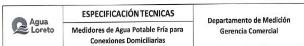
Cuadro N° 7