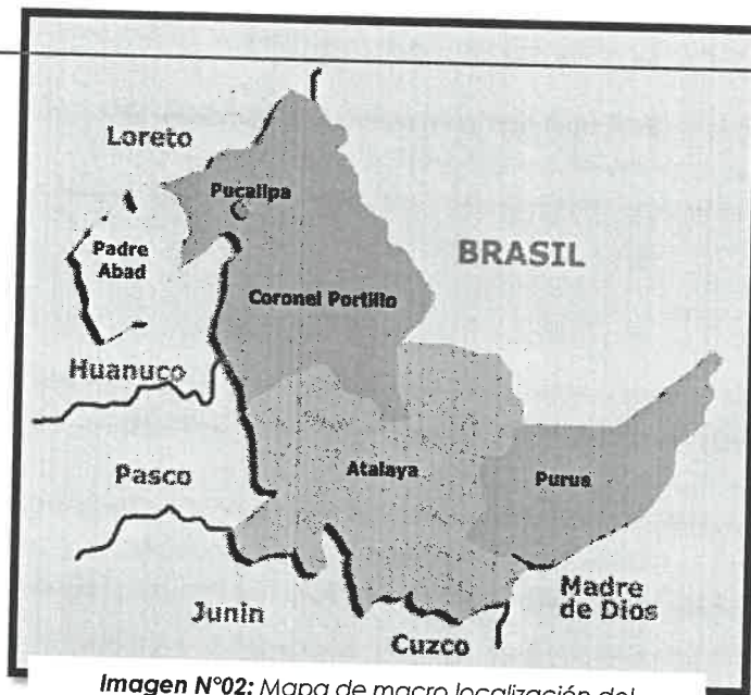
Imagen N°02: Mapa de macro localización del Departamento de Ucayali