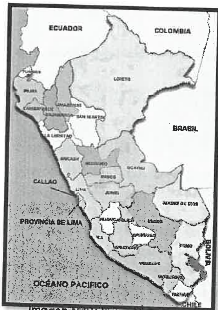
Imagen N°01: Mapa de macro localización del Perú

El 28 de septiembre de 1,928 se creó el Distrito del Alto Ucayali y el 29 de septiembre de ese mismo año, el Presidente de la República Augusto B. Leguía, promulgó la ley que creó el Distrito del Alto Ucayali con la localidad de Atalaya como capital. Posteriormente, con Decreto Ley N° 23416 del 1° de junio de 1,982 se creó la Provincia de Atalaya, manteniendo a la localidad de Atalaya como su capital, que ascendió al rango de Villa.