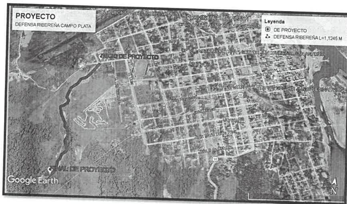
Imagen N°03: Mapa de micro localización del terreno para el proyecto con el Centro de la Ciudad.