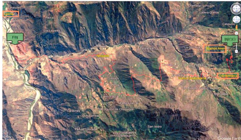
IMAGEN N° 2 VISTA FOTOGRAFICA DEL PLANO CLAVE DEL PROYECTO A EJECUTAR.