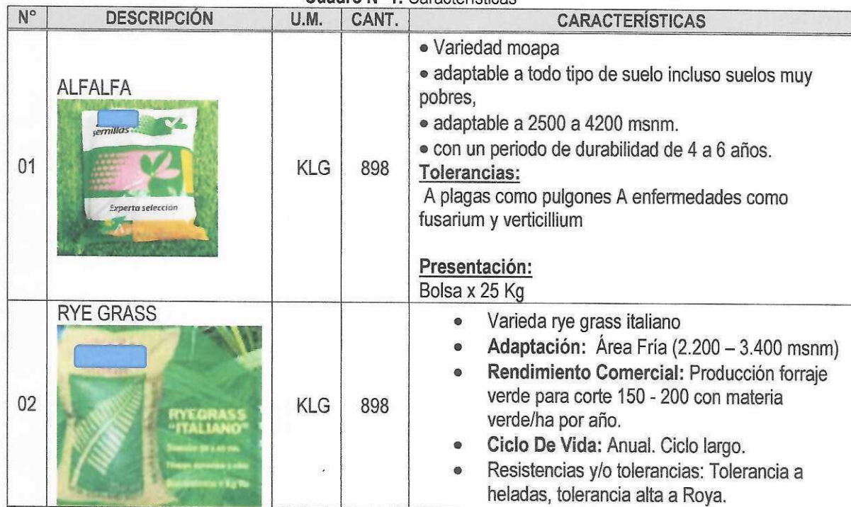
Cuadro N° 1: Características

El objeto del requerimiento tiene por finalidad la adquisición de semillas de alfalfa y rye grass para la ejecución del proyecto cuyes.