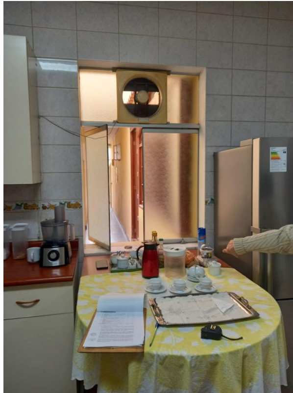
Ventana que se debe modificar