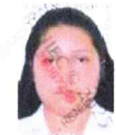
Foto del Ciudadano